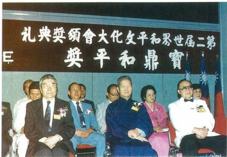
獎頒備準後席入軍將谷式俄、長事理環延吳、長院戎肅梁邊左