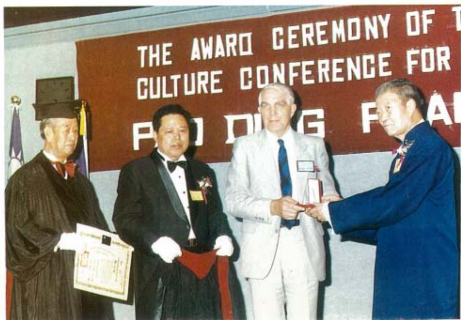
薪月領不職務義是均年36他因獎頒「長書秘會整重德道國萬」洲澳為長事理吳