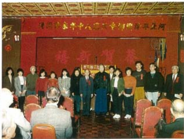
發頒節春年十八國民會鄉同津平北河 金學獎頌佩楊全東迓全民法孫