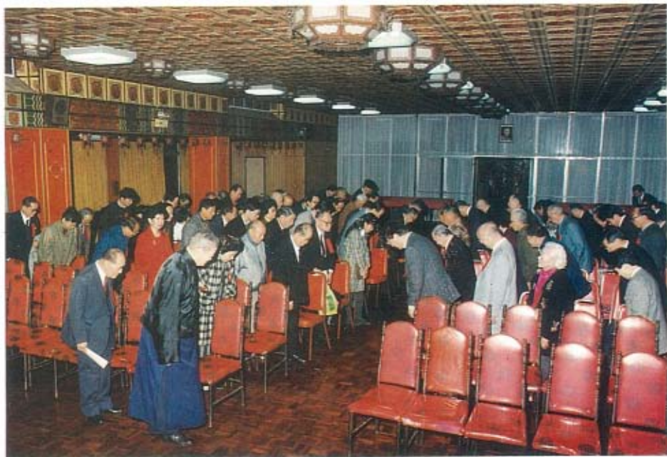
河北平津同鄉會國民十八年春節團拜