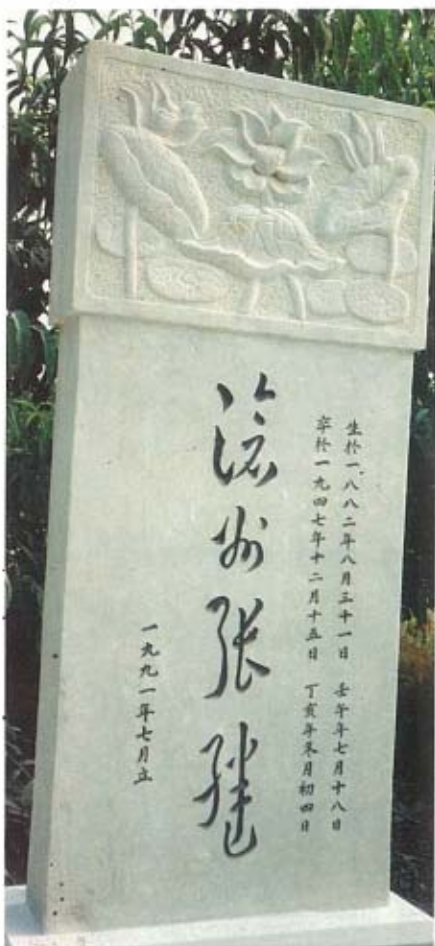
地墓泉溥張墓公田福處大山西京北