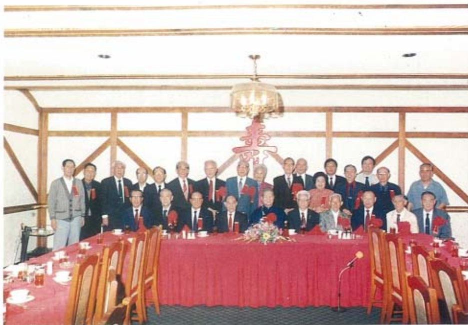
河北平津同鄉會重陽節敬老祝壽會中華民國十八年十月十六日